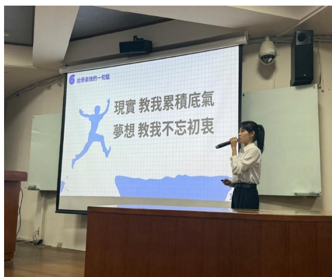
說明：實習組學生發表