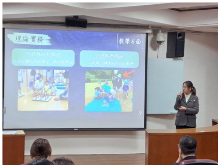
說明：實習組學生發表