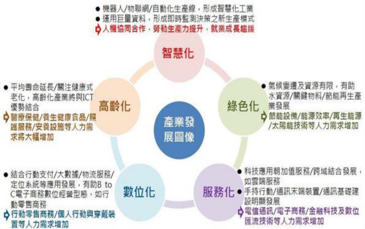
圖 1：產業與人力需求發展圖像

資料來源：國家發展委員會/產業人力供需資訊網/未來 10 年整體就業人力推估 ( http://theme.ndc.gov.tw/manpower/Content_List.aspx?n=B615E37678E4E021 )