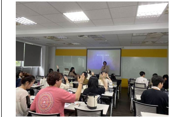
說明：有獎搶答環節