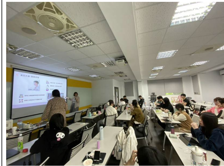
說明：香水試聞環節