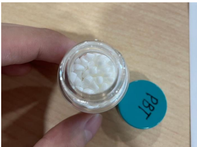
說明：廠區提供研發成品讓師生近距離觀察