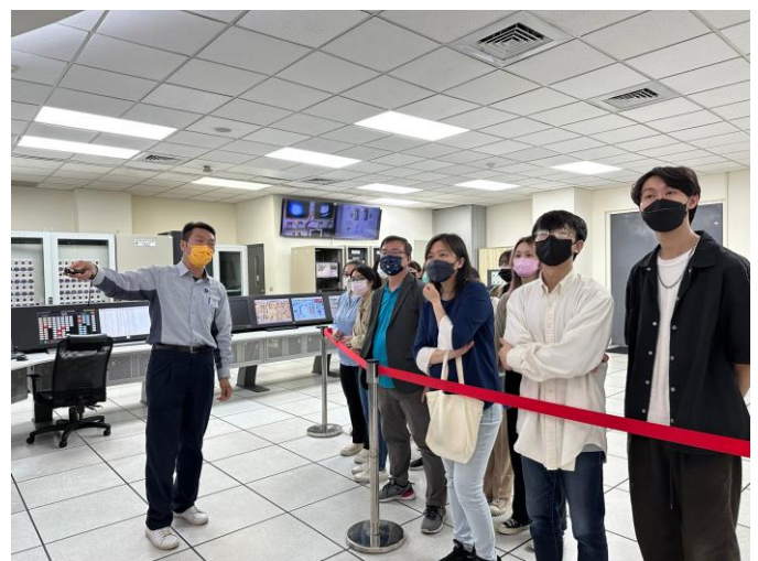
說明：參觀廠區儀控室由專員解說如何操作