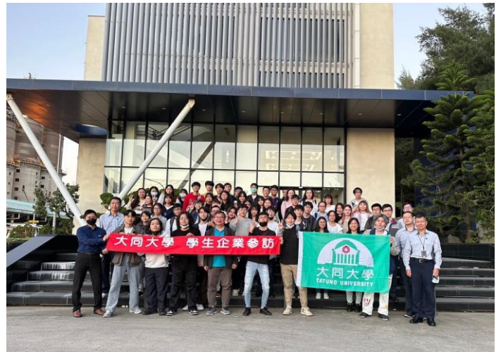
說明：全體參與師生與亞東石化觀音廠區人員合影