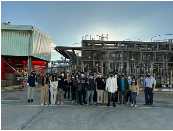
說明：參觀廠區內化工程序實際運作現場