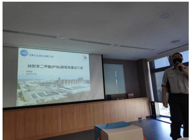
說明：廠區工程師向師生介紹廠區製程與相關產品