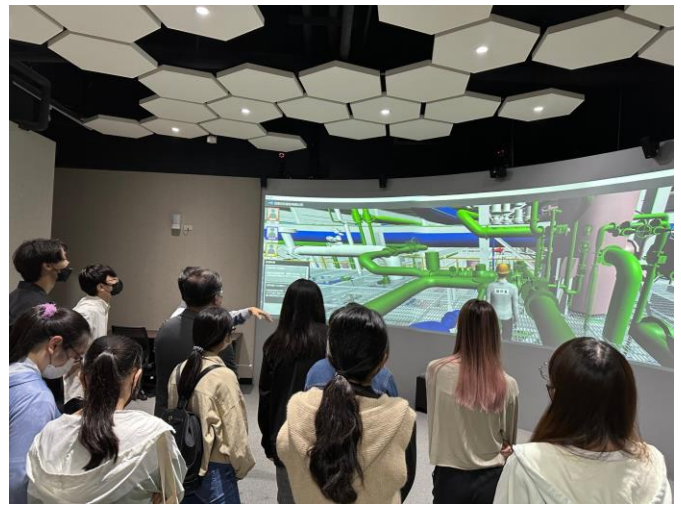
說明：師生體驗廠區設置之 VR 訓練室